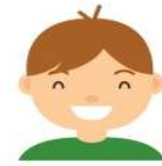
Juan Colegio X